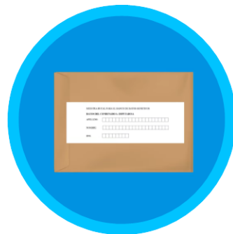
Kit para la toma de muestra

La toma de muestra es realizada por el mismo donante usando el dispositivo BODE diseñado para la toma de muestras de epitelio bucal.