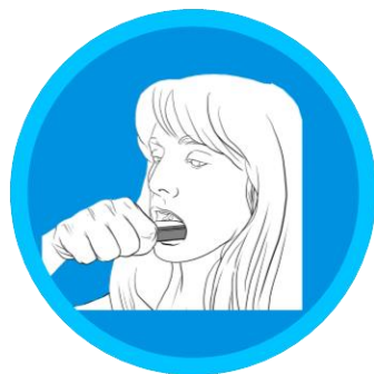
Toma de muestra de epitelio bucal

Personal autorizado supervisa la toma de muestra, completa el formulario e inicia el documento de Cadena de Custodia.